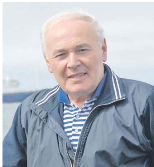
Губернатор Магаданской области Владимир ПЕЧЁНЫЙ:

- Для нашей области добыча и переработка водных биоресурсов - один из основных аспектов экономической деятельности. Это и укрепление позиций Магаданской области в России и Азиатско-Тихоокеанском регионе, и налоги, рабочие места, решение вопросов экономической безопасности. А потому предупреждение, сдерживание и ликвидация незаконного и нерегулируемого промысла - задача первоочередная. В год экологии сам Бог велел защитить от браконьерства достояние территории.