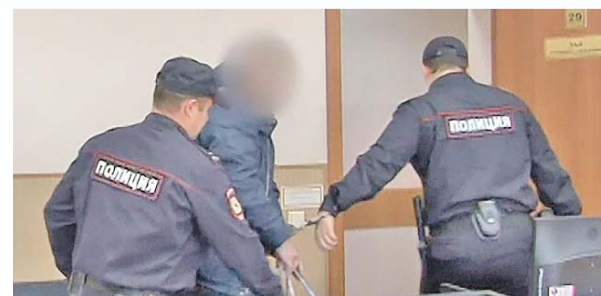
По материалам пресс-центра МВД России